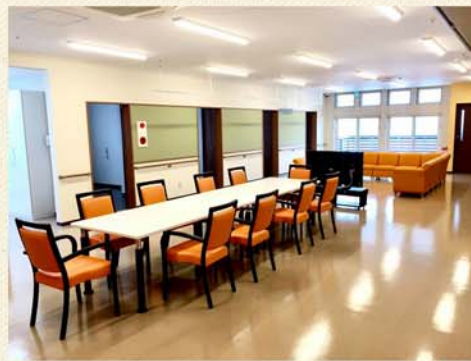
ホール（ダイニング）